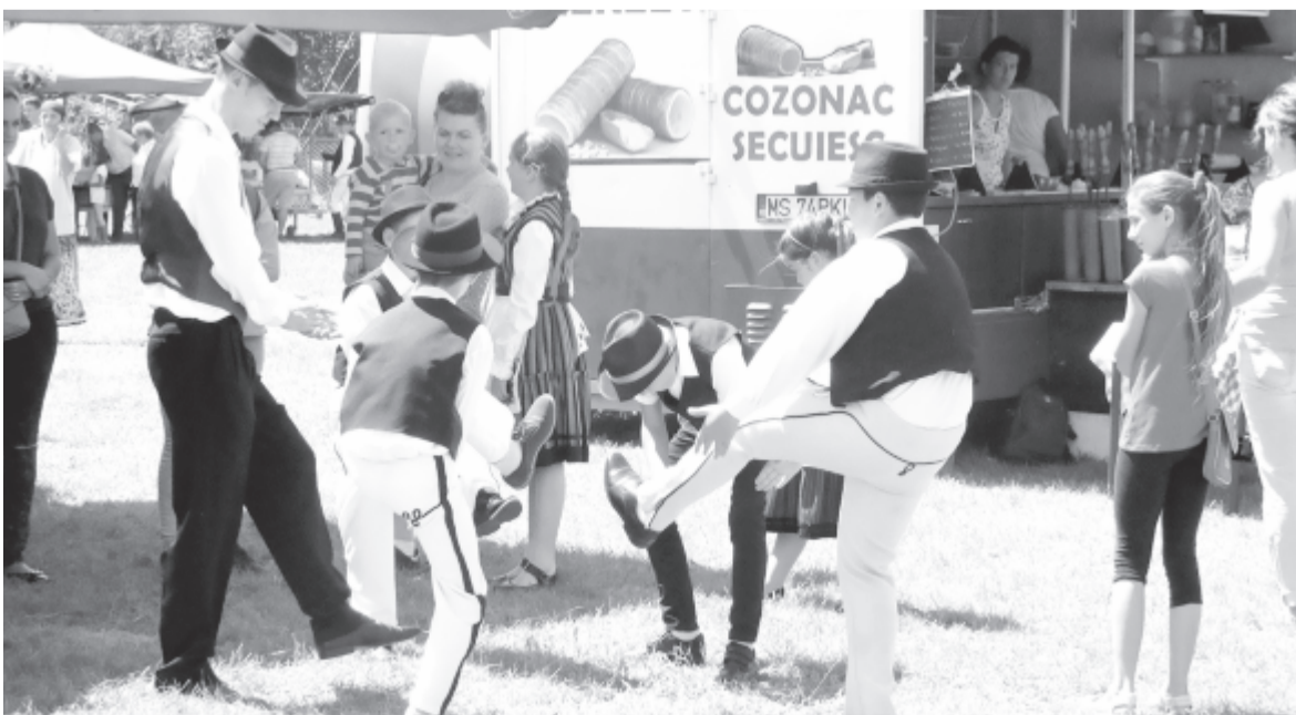
Tánc, jókedv nemcsak a színpadon, hanem a nézőtérén is