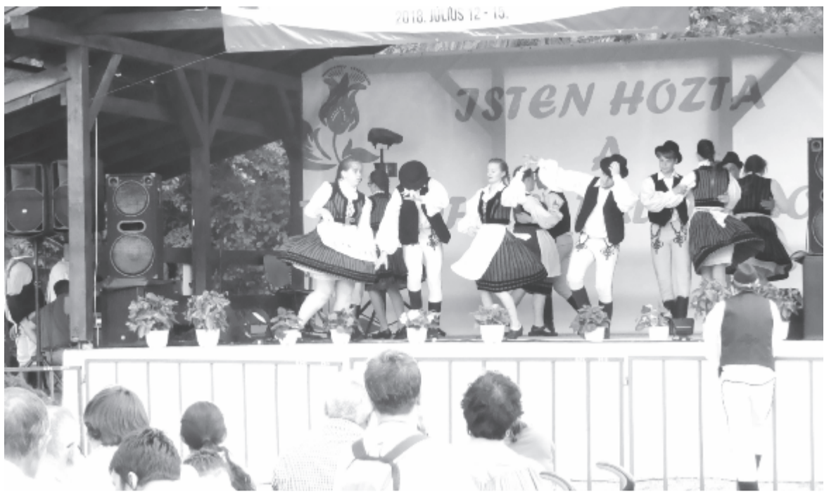
A mezőségi magyarok számára sokat jelent a hagyományörzés

Szombaton a sportpályára költözött a rendezvény: a délután folyamán hét csapat részvételével