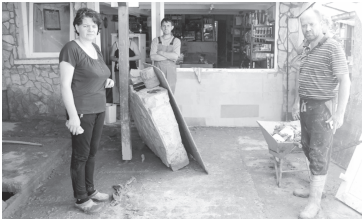
A vegyesbolt kidőlt falát visszaállították, az eredeti még a földön hever

ton megnyitottuk az üzletet, de csak egyetlen napig árusíthattunk, mert vasárnap érkezett a második, még hatalmasabb erejű áradás. Az első elvonulása után az elromlott hűtőszekrényeket megjavíttatták, de az a kiadás hiábavalónak bizonyult, hisz a második még a hűtők ajtaját is leszakította, és immár teljesen használhatatlanná váltak. Tíz éve a férjemmel se szabadnapon, se szabadságon nem voltunk, az államnak havonta 5.000–6.000 lejt be kell fizetnünk a vállalkozás utáni adók és járulékok címen, egy ilyen katasztrófa után azonban nincs kitől segít-