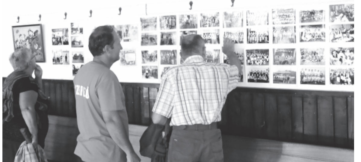
A falu múltjába visszatekintő fényképképző kiállítás nyílt

Vasárnap a mezőcsávási rezsebanda ébresztette Csávás és Fele lakóit, hamarosan pedig a lelkes