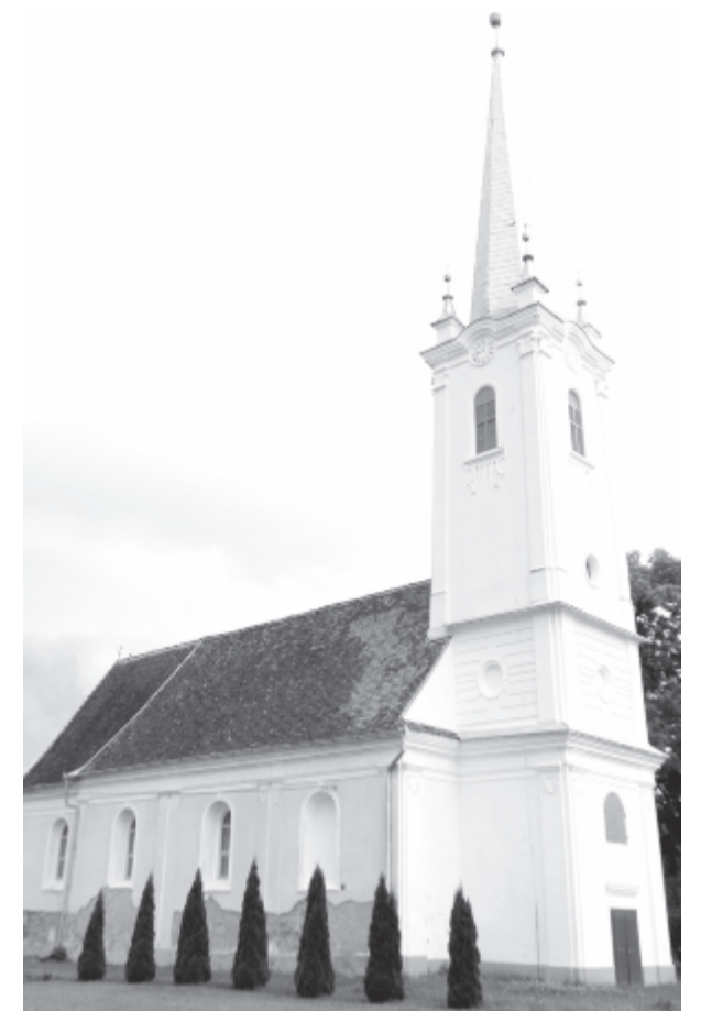
Idén és ebben a formájában kétszáz éves a madarasi templom – a felújítással méltóan ünnepelnék meg

szépülés is következik” – mutatott rá a lelkész. A madarasi templom idén éppen kétszáz éves, azaz mai formájában 1818-ban kezdték el építeni Vályi Pál lelkész idejében, majd 1825-ben fejezték be Losonczy Mózes vezetésével. Az azelőtti templomot 1629-ben építették, de ennél jóval korábbi istenháza is lehetett a falunak, ugyanis a jelenlegi épület falában a vakolat leverése után felbukkant egy középkori, katolikus korból származó szentségtartó fülke kődarabja, amit a templomba beépítve egy sokkal régebbi korra kívántak utalni az elődök.